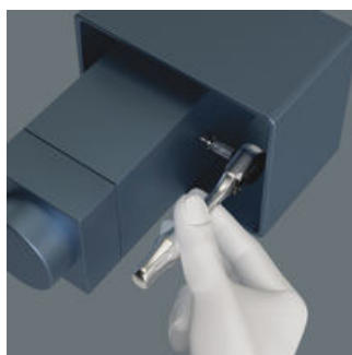
Mini-spärrhandtag för alla svårtillgängliga platser.