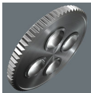
Fintandad mekanism med 60 tänder ger en så kort returvinkel som 6° för precist arbete.