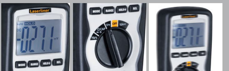
Stor belyst display