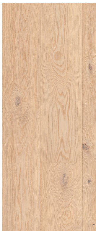
Eg Country børstet hvid Varenr.: 145084n DB nr.: 2119606