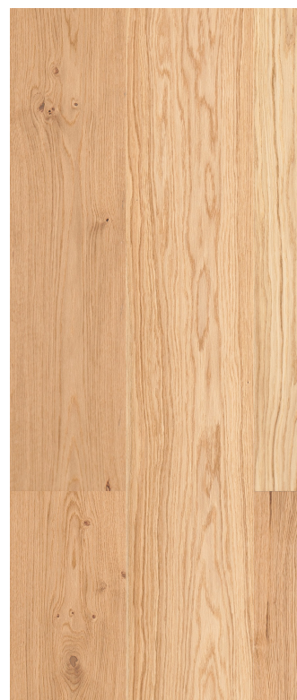
Eg Country børstet natur Varenr.: 145085n DB nr.: 2119609