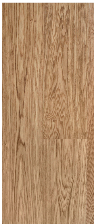
Eg Prime børstet natur Varenr.: 145092n DB nr.: 2119614