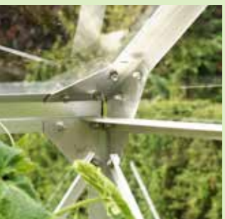
Hörnförband i Uranus

Ett stort växthus kan användas som en kombination av lusthus och växthus.