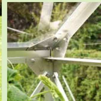
Hörnförband i Merkur

Alla Merkur-modellerna kan levereras med 6 mm kanalplast i taket och glas i resten av huset.