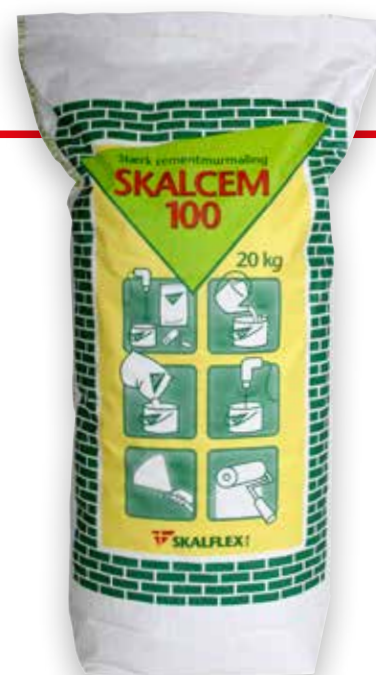
20 kg, DB-nr. 3859592 (Hvid)