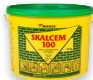
10 kg, DB-nr. 3859634 (Hvid)