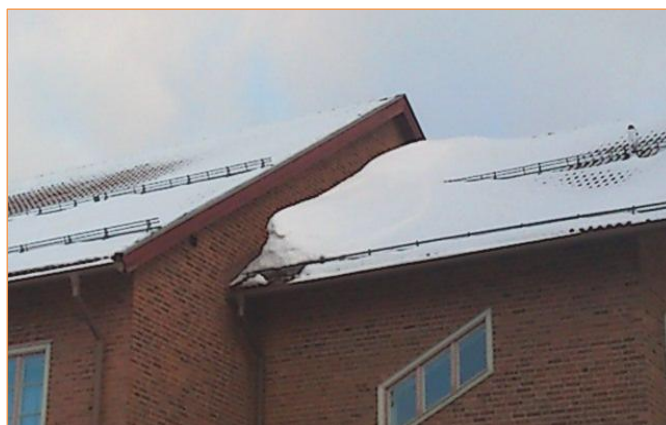
Bild t.h. Vid en höjdskillnad mellan taken på 2 meter i snözon 2,5 blir snömängden (vikten) ca 100 % högre närmast hindret.

Ansamlingar av snö på grund av luftrörelser/virvlar kring uppbyggnader, högre tak, hinder mm måste särskilt beaktas på grund av ökade laster. Inom områden på taket där snöansamlingar kan förväntas kan man öka hållfastheten på snörasskyddet genom att minska konsolavståndet. Observera att snöns densitet ökar i dessa fall.