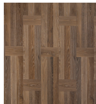
Hollænder Amsterdam Varenr.: 155055 DB nr.: 2257900