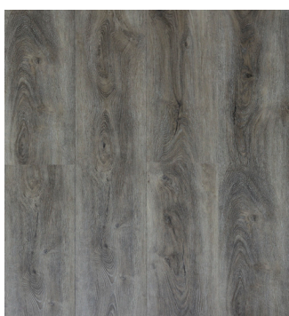
Fashion Oak Varenr.: 155011 DB nr.: 1960374