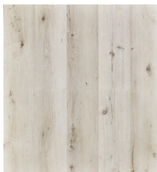
Ashford Oak Varenr.: 155092 DB nr.: 1965851