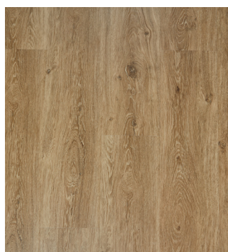
Natural Oak Varenr.: 155026 DB nr.: 1965793