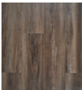
Smoked Oak Varenr.: 155019 DB nr.: 2257898