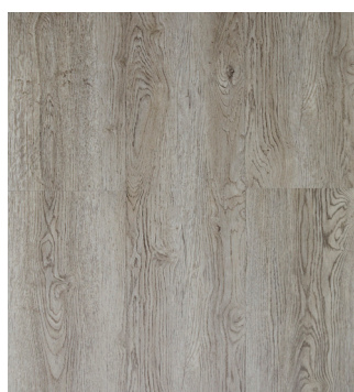
Grey Oak Varenr.: 155016 DB nr.: 1960380