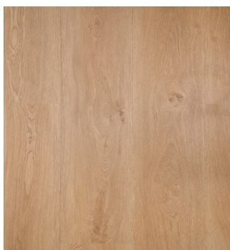
Texas Oak Varenr.: 155028 DB nr.: 2215646