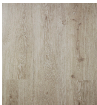
Urban Grey Oak Varenr.: 155032 DB nr.: 1988014