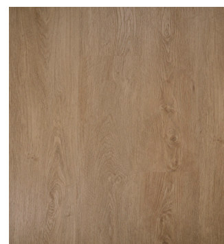
Colorado Oak Varenr.: 155027 DB nr.: 2215645