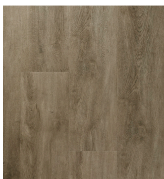
Steel Oak Varenr.: 155013 DB nr.: 2073299