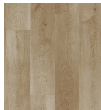
Oregon Oak Varenr.: 155017 DB nr.: 2121003