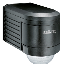
Svart 13 120 74