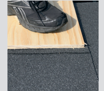
Samlingen trykkes sammen ved at man ligger en trykfordelingsplade og træder på den.