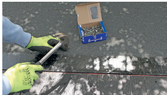
Banerne er på langs af rullen forsynet med en klæbekant, hvor i der sømmes med galvaniseret papsøm med 20 cm mellemrum.