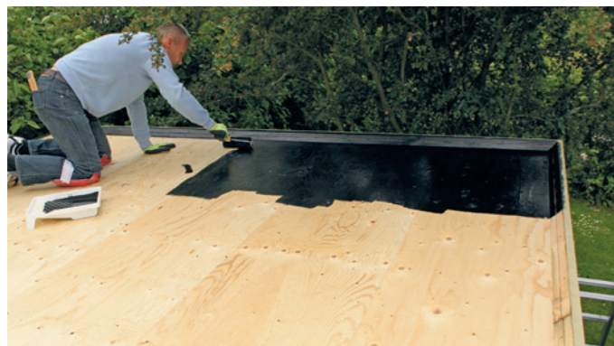
For at forbedre vedhæftningen grundes underlaget med en bitumen primer, tørretiden er afhængig af vejret og vil i de fleste tilfælde være ca. 1 døgn.