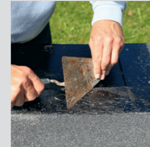
Er der behov for at lave en samling over enden af rullen, skræbes skiffer granulatet af nederste rulle på minimum 15 cm.