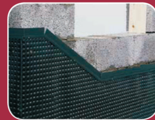
FUGT OG RADONSIKRING