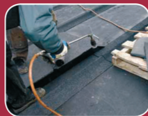
TAG OG TILBEHØR