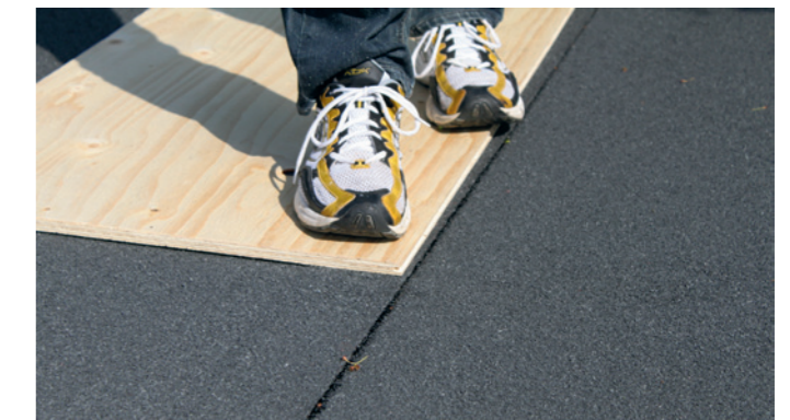
Læg en trykfordelingsplade på taget, og der trædes rundt på hele pladen, over hele taget, specielt samlingerne skal trykkes godt. Taget er nu klar til at modstå mange års vejrlig.