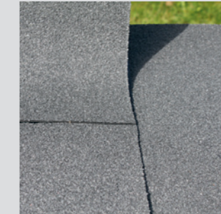
Øverste rulle monteres.