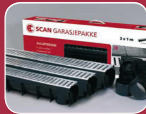
HAVEN / UDEMILJØ