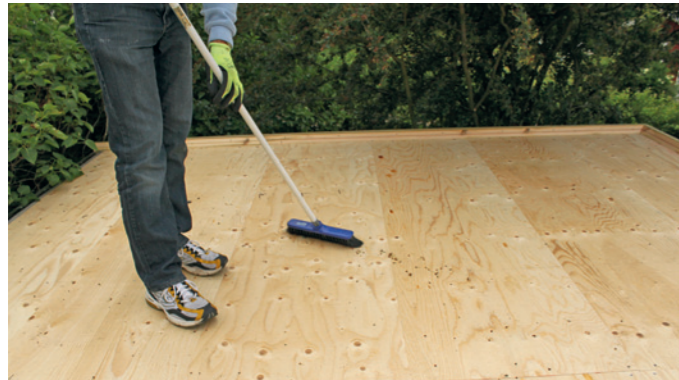
Taget efterses og rengøres.

Izosef Reflex P4 er en et lags selvklæbende tagpap som kun må benyttes til sekundære bygninger som; udhuse, havehuse, legehuse osv. Med et minimumsfald på 2.5 cm./m. Underlaget skal være jævnt, stabilt, tørt, støvfrit og fri for urenheder. Izosef Reflex P4 kan monteres ved temperaturer over +5 C. (ved temperaturer mellem +5 /+15 C er det nødvendigt at opvarme tagpappen med en varmepistol, for at øge vedhæftningen). Pålægningen skal foregå i tørvej, da fugt og regnvej vil forringe klæbeevnen.