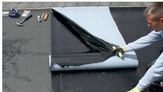
Banerne monteres i tagets falderetning, og ved samlinger må der ikke forekomme modfald. For at holde retning på rullen er det en god ide at bruge en kridtsnor. Rullen rulles ca. halvt ud der hvor man ønsker at montere den, den del som man ønsker at montere først vippes frem (så bagsiden vender op af) beskyttelsesfilmen afrives, vigtigt at den hvide side af beskyttelsesfilmen ikke kommer i berøring med undersiden af tagpappen, den vil i givet fald være meget vanskelig at få af igen.