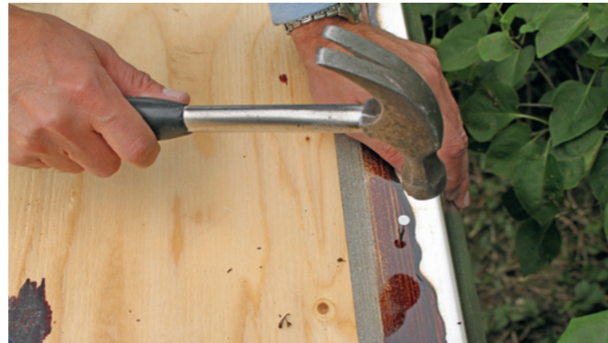
Der monteres fodblik v/tagfoden så vandet kan dryppe af, og der monteres trekantlister langs vindskederne så knæk og skarpe buk på tagpappen undgås.