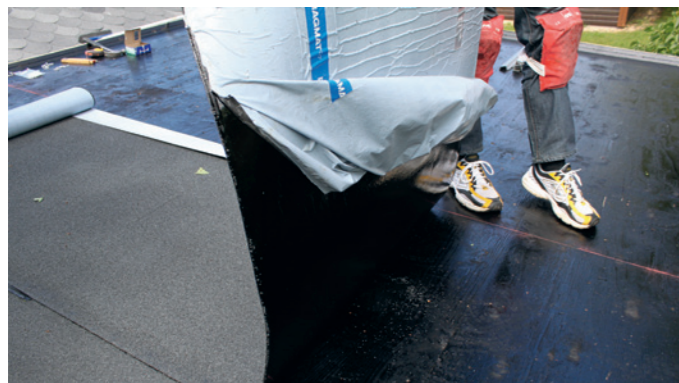
Den del hvor beskyttelsesfilmen er afrevet, kan nu forsigtigt monteres (god ide at være 2 til dette, da rullen ikke kan flyttes når først den er monteret).