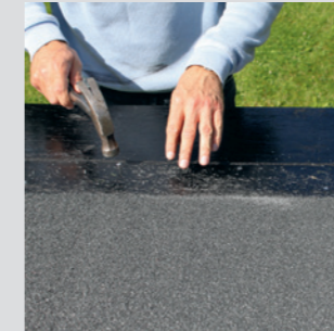
Nederste rulle fastsømmes med galvaniseret papsøm i samlingen.