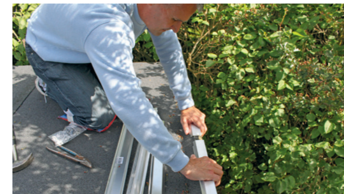
Kanter og inddækninger afsluttes med alu-profiler.