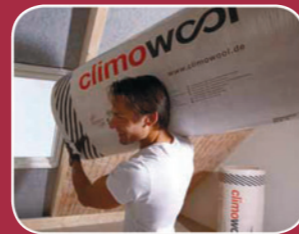
GIPS, STÅL OG ISOLERING