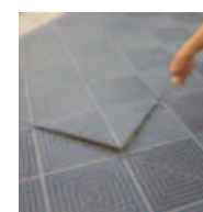
Kant- och Hörnlist