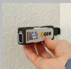
Fällbart stift som möjliggör hörnmätningar