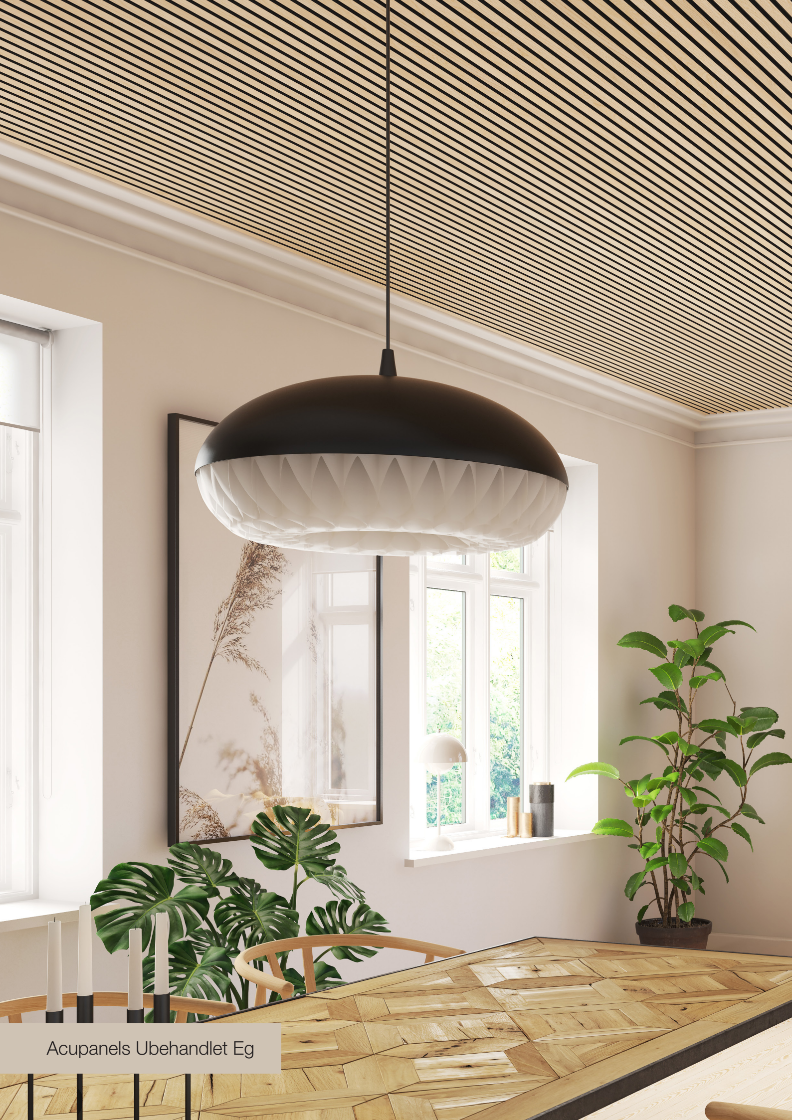
Acupanels Ubehandlet Eg