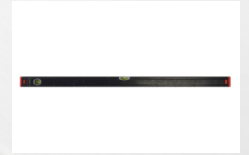
Vatten- pass/ linjal