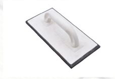
Rubi Grout Gloat