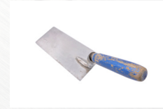
Spackel- spade/ murslev