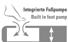
Integrierte Fußpumpe Built in foot pump

ANTI-RUTSCH-FUNKTION durch spezielle Pads auf der Unterseite