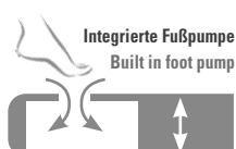
Integrierte Fußpumpe Built in foot pump

ANTI-RUTSCH-FUNKTION durch spezielle Pads auf der Unterseite