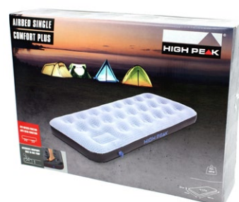
▶ 38 x 28 x 8,5 cm

ANTI-SKID-FUNKTION due to special pads on backside