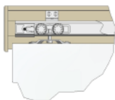
Illustration av rulle i skena