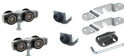
Rullar, ändstop, bärplattor, styrmoten