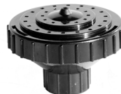
Fontænedyse / Fontänmunstycke