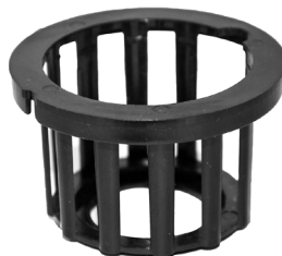
Kurv til tågemaskine / Nätkorg till rökmaskin