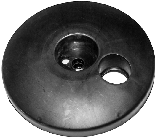
Flydering / Flytring