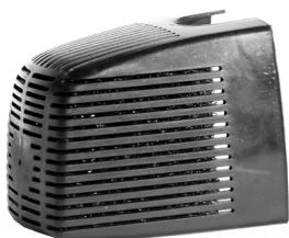
Filterhus / Filterkåpa