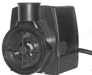
Pumpemotor med rotorlåg / Pumpmotor med rotorlock