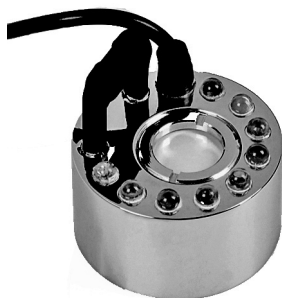
Tågemaskine med 1 membran og 9 lysdioder Rökmaskin med 1 membran och 9 ljusdioder