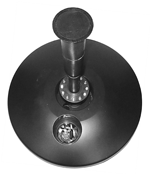
Flydende pumpe FP 3000 med LED-lys og tågemaskine Flytande pump med LED-ljus och rökmaskin

Vi henviser til brugsanvisningerne for hhv. LED ring og tågemaskine.