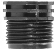
Gevindreduktionsring / Gängad reduceringsring