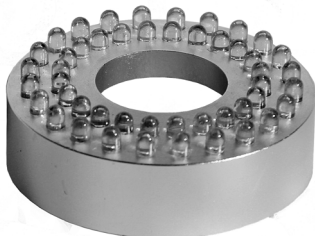
LED-ring med 48 dioder / LED-ring med 48 ljusdioder