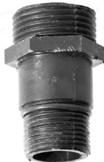
Nippelreduktion / Reduceringsnippel