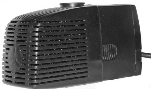
Pumpe / Pump