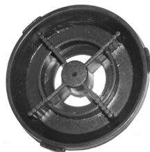
Rotorlåg / Rotorlock