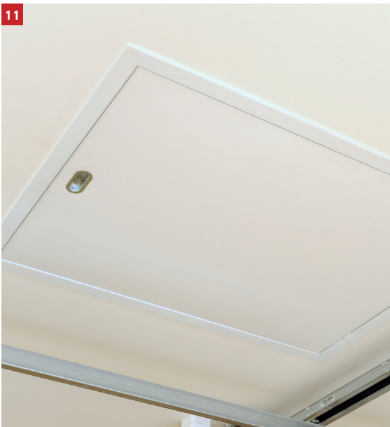
Drop-down door, ready to open