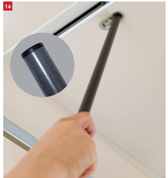
16 Use the operating pole to close the drop-down door - Anvend evt. stangen til at lukke lemmen helt - Använd evt. stången för att stänga luckan helt - Bruk ev. stangen til å lukke lemmen helt