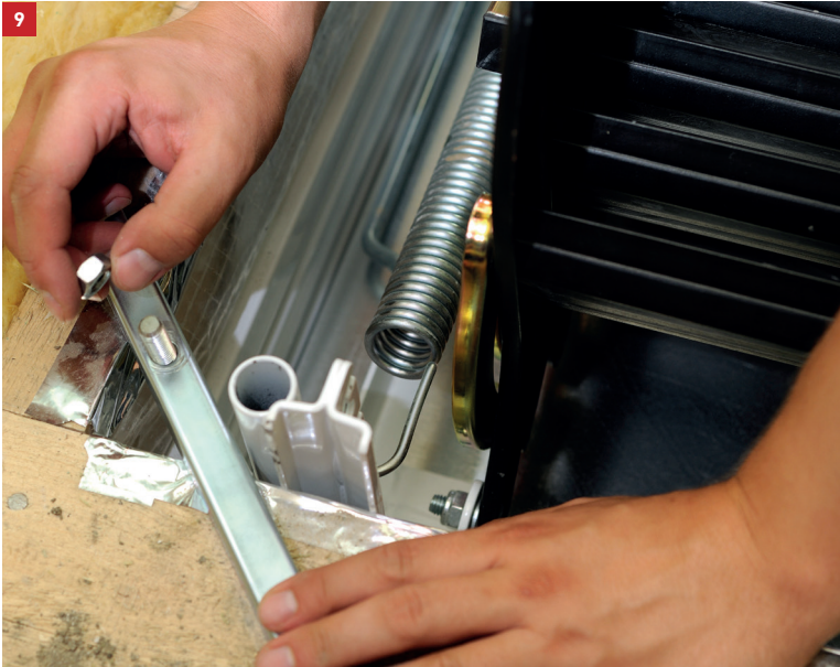
Fastening the frame using the 4 supports