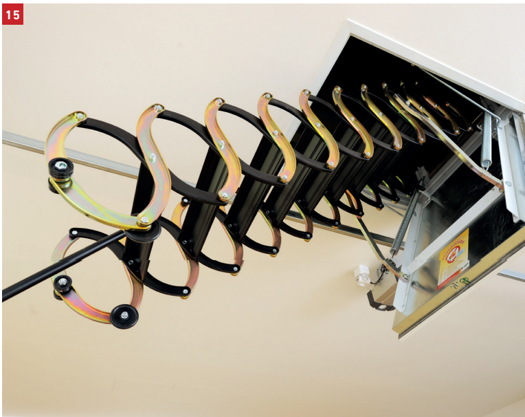
15 Stowing the loft ladder away before closing - Stigen skubbes op inden lukning - Skjut upp stegen innan luckan stängs - Stigen skyves opp før lukking