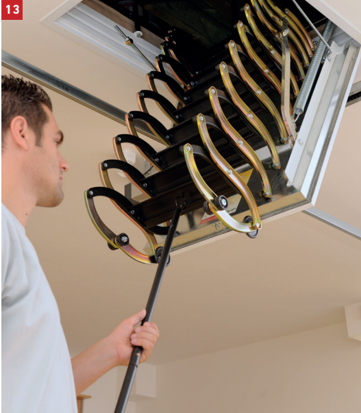
13 Releasing the ladder with the operating pole - Betjeningsstangen anvendes også til nedtagning af stigen - Stången används också för att dra ner stegen - Betjeningsstangen brukes også til å ta ned stigen