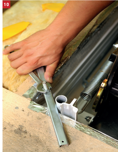
Proper fastening of the 4 anchoring bolts