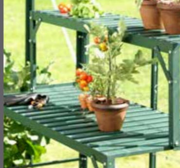
Överdel till aluminiumbord, grön