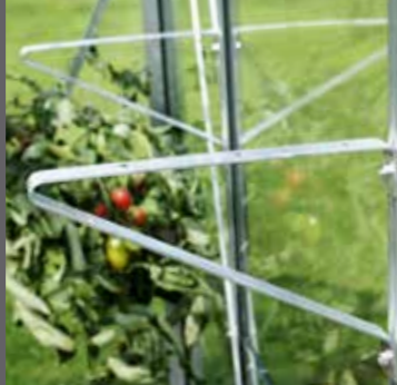
Hyllkonsoler · 2 st inkl. bult & mutter