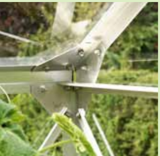
Hörnförband i Uranus

Ett stort växthus kan användas som en kombination av lusthus och växthus.