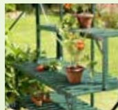
Överdel till växthusbord