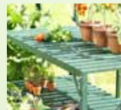
Växthusbord med extra hyllplan