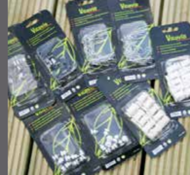
Clips, Bult, Mutter och uppbindningskrok m.m.