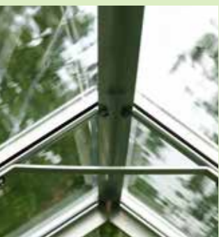
Takstöttor i Venus

Köp inte ett för litet växthus. Ingen har någonsin klagat över att deras växthus är för stort!