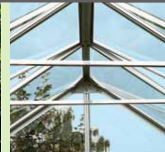
Takstöttor i Merkur/Mars

Alla Merkur-modellerna kan levereras med 6 mm kanalplast i taket och glas i resten av huset.