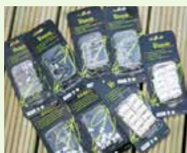
Diverse små tillbehör