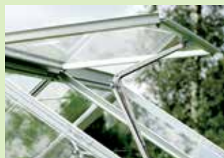
Ekstra tagvindue & automatiska vinduesåbnere