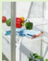
Hyllset till IDA