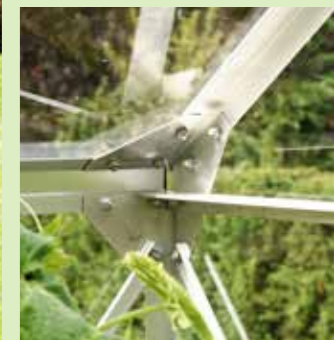
Hörnförband i Merkur

Alla Merkur-modellerna kan levereras med 6 mm kanalplast i taket och glas i resten av huset.