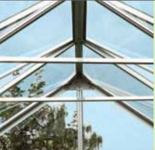
Takstöttor i Uranus

Ett stort växthus kan användas som en kombination av lusthus och växthus.