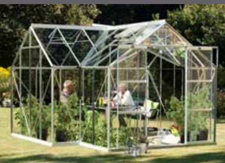
SIRIUS 13000 - anodiserad aluminium

På vår hemsida www.bony.se finner du detaljerad beskrivning av våra tillbehör och monteringsanvisningar samt mycket annan nyttig information.