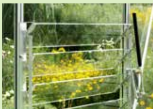
Jalousivindue & automatisk jalousiopluk

På vår hemsida finner du detaljerad beskrivning av alla våra tillbehör samt monteringsanvisningar och mycket annan nyttig information.