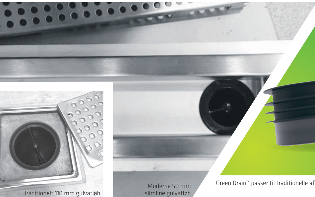
Traditionelt 110 mm gulv afløb