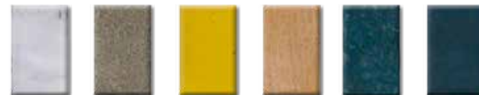
PVC Betong och bruk Keramik Trä Galvaniserat stål Stål

■ Kan användas på de flesta underlag inom- och utomhus t ex