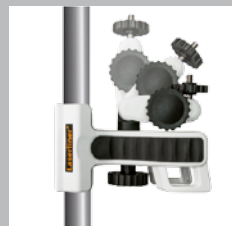
Kan fästas justerbart och mångsidigt