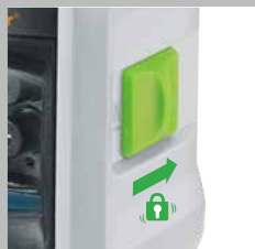
Pendellås för transportsäkring