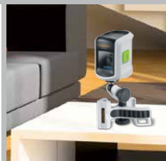
FlexClamp Plus med stå