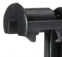
Nez lisse permettant de ne pas endommager la surface de la plaque de plâtre.