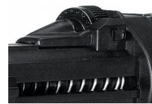
Molette de réglage de la pénétration de la tête de la vis dans le support.