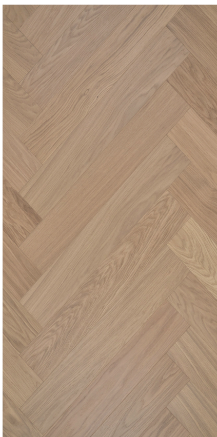
Eg Sildeben Innoplank hvid Varenr.: 147010 DB nr.: 2301093