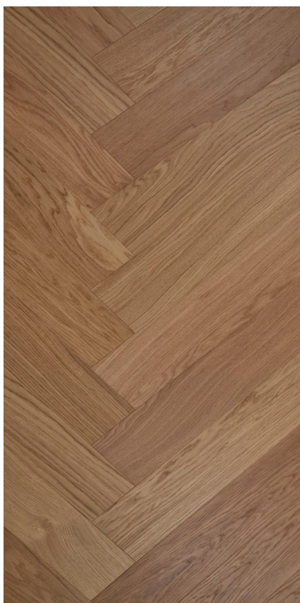
Eg Sildeben Innoplank natur Varenr.: 147100 DB nr.: 2301092