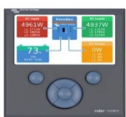
Color Control GX