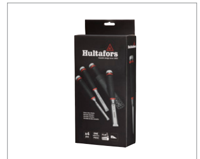
Stämjärnen är förpackade i en kartong.