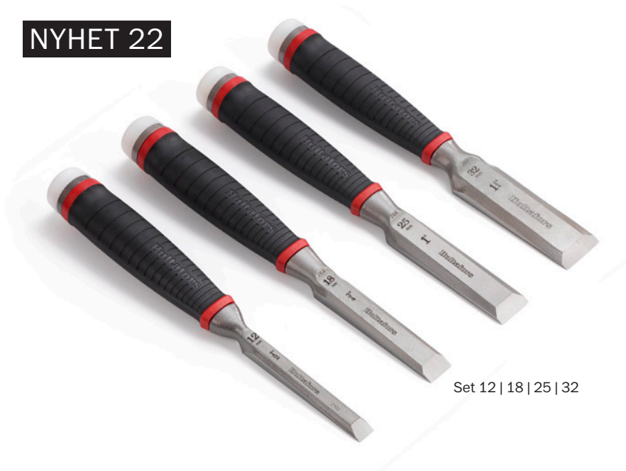
Set 12 | 18 | 25 | 32

Set med 4 stämjärn och hölster för alla sorters arbeten vare sig de kräver styrka eller precision. Smidda i ett stycke med två hårdzoner och en I-profil som går genom hela handtaget. Det ger dem extrem brytstyrka och maximal kraftöverföring ner i arbetsstycket.