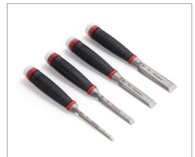
Set 6 | 12 | 18 | 25