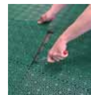
Kant- och Hörnlist