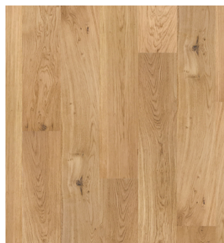
Eg Accent børstet Varenr.: 145023s DB nr.: 2307333