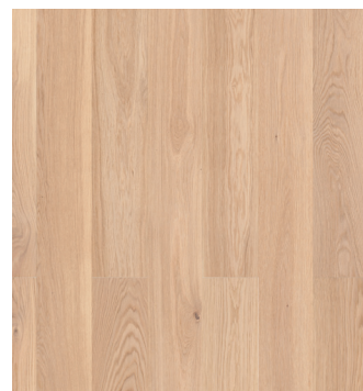
Eg Prime børstet Varenr.: 145070s DB nr.: 2307348